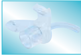
DURATWIX® JUNIOR PED

Die DURATWIX® JUNIOR Trachealkanüle wurde speziell für die spezifischen Anforderungen von Neugeborenen und Kleinkindern entwickelt.