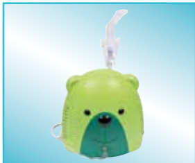
NEBUJUNIOR® Bär mit Mundstück

Zur Pflege und Reinigung ist der NEBUJUNIOR® Inhalator leicht in die einzelnen Bestandteile zerlegbar.